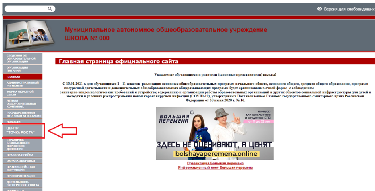
Рисунок 2. Пример размещения ссылки на раздел на сайте общеобразовательной организации

На официальном сайте общеобразовательной организации, в которой создается центр образования естественно-научной и технологической направленностей «Точка роста» (далее – центр «Точка роста», центр) в рамках федерального проекта «Современная школа» национального проекта «Образование», не позднее даты начала функционирования центра (не позднее 1 сентября года создания центра) создается раздел «Центр «Точка роста»». Ссылка на раздел размещается в главном меню сайта общеобразовательной организации и должна быть видима при просмотре каждой страницы. Ссылка не может являться вложенной в другие меню. Пример размещения ссылки на раздел «Центр «Точка роста» в меню официального сайта общеобразовательной организаций в информационно-телекоммуникационной сети «Интернет» приведен на рисунке 2.